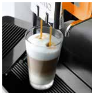
+ Große Auswahl an Espressovarianten, zum Beispiel Latte Machiatto