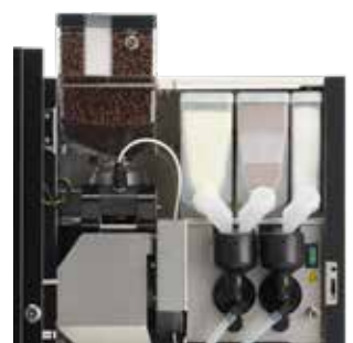
+ OptiBean 4, 2 Mixer und 3 Zutatenbehälter