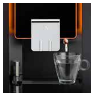
+ Separate Heißwasserzapfstelle