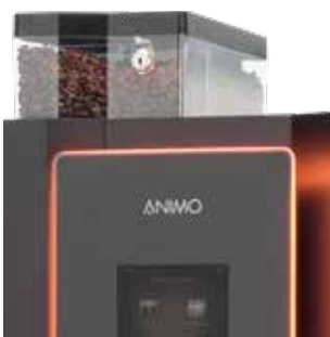
+ Frische Kaffeebohnen

Zusätzlich zum OptiBean ist der OptiBean XL mit einem extra großen Espresso-System für größere und vollere Tassen ausgestattet.